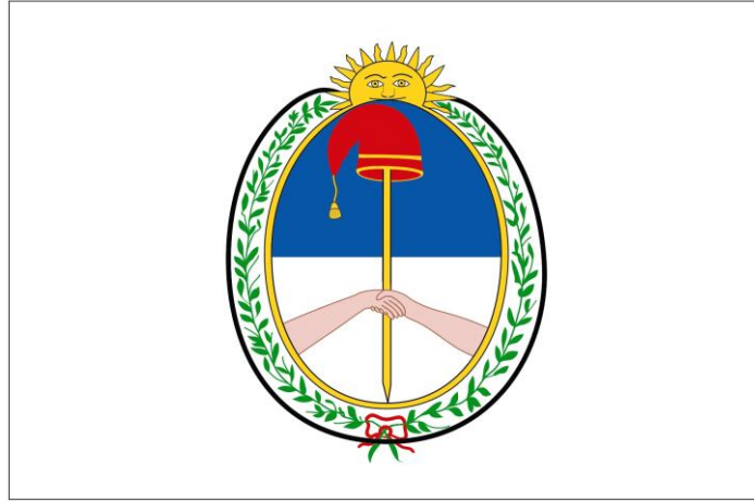
Bandera Nacional de la Libertad Civil (imagen vectorial diseñada por Francisco Gregoric)

Modelo patrón al que deben ajustarse todas las reproducciones según dispone la ley N°27.134