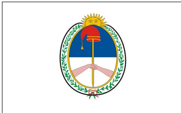
Ilustración de Francisco Gregoric